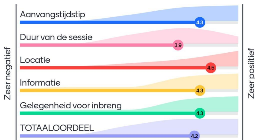
Figuur 1: Oordeel van deelnemers over de bijeenkomst op een schaal van 1 tot 5

Na afloop van de bijeenkomst zijn alle deelnemers gevraagd om de werksessie via Mentimeter te beoordelen. In het figuur hieronder staan de uitkomsten van deze beoordeling. Deelnemers is gevraagd een oordeel te geven over zowel de totale bijeenkomst als een aantal onderdelen ervan (zoals de locatie of de gedeelde informatie) met een cijfer tussen de 1 (zeer negatief) en 5 (zeer positief).