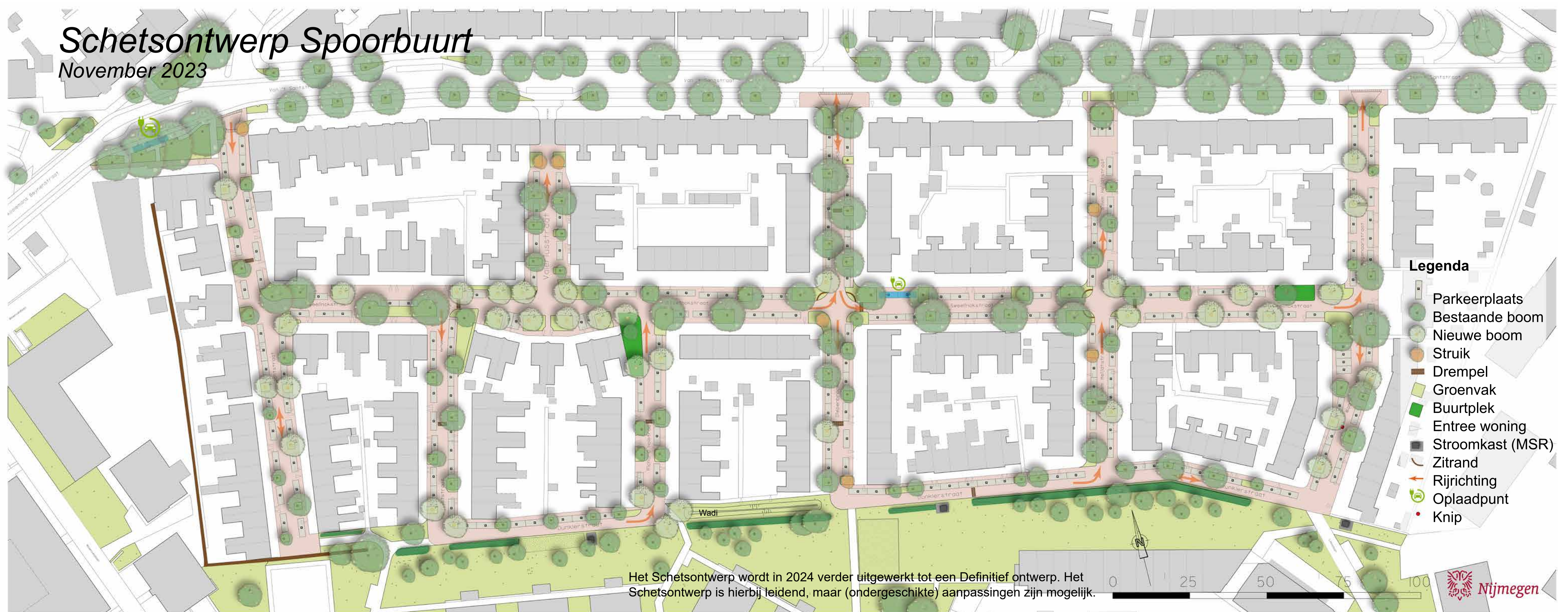
Schetsontwerp Spoorbuurt November 2023

Voor meer informatie ga naar: https://nijmegen.mijnwijkplan.nl/project/herinrichting-spoorbuurt