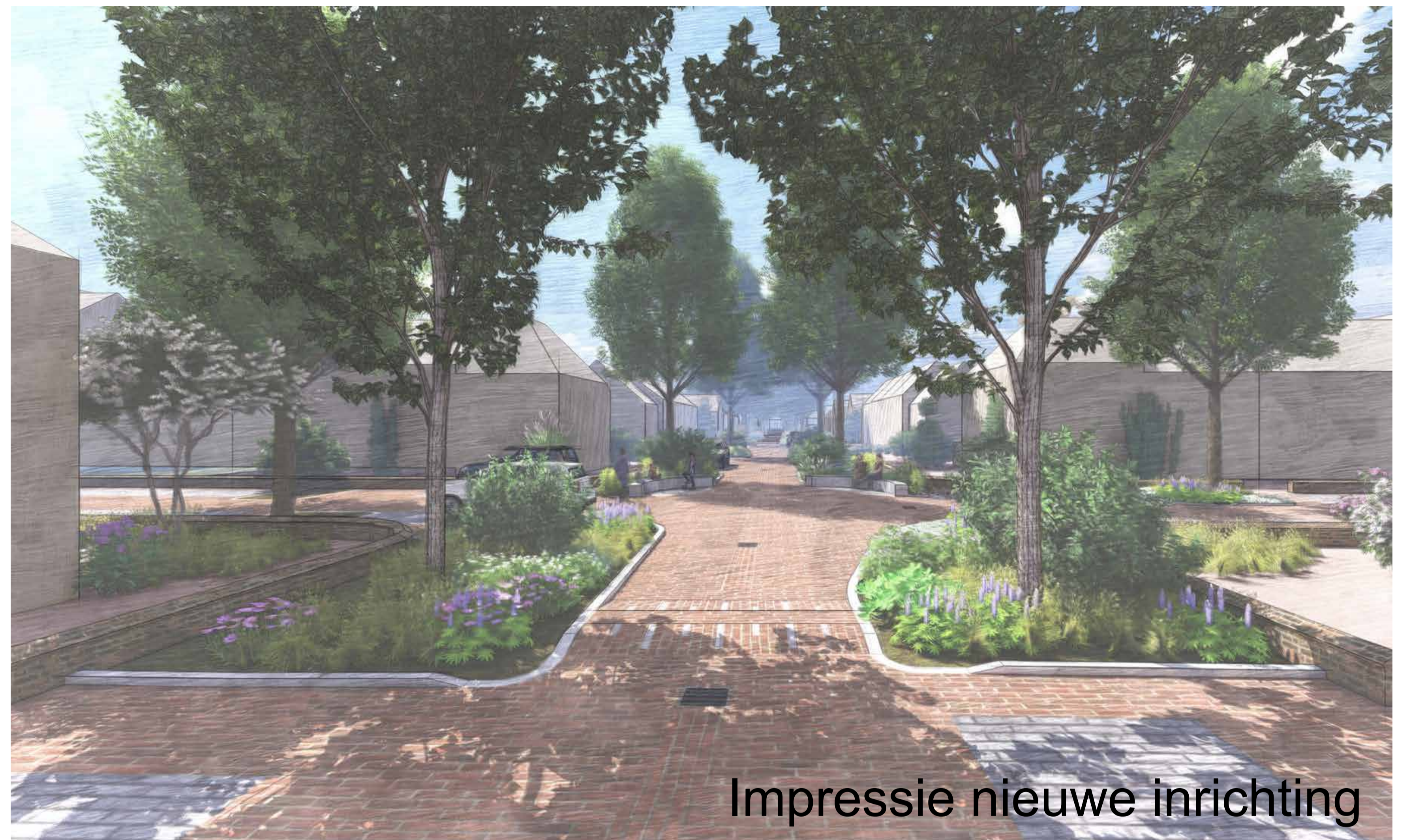
Impressie nieuwe inrichting

Door het maken van grotere boomspiegels lossen we meerdere problemen op: de wortelopdruk, meer groen in de straat en meer mogelijkheden om regenwater te infiltreren.