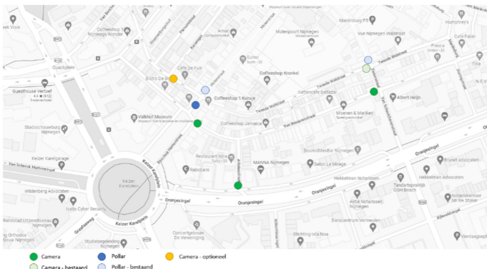
Afbeelding: beoogde plaatsing camera's en poller

De parkeergelegenheid op het Molenpoortdak is bedoeld voor bezoekersparkeren. Bezoekers van de winkels in de binnenstad kunnen tijdens de reguliere openingstijden parkeren op het Molenpoortdak, aangezien de afsluitingstijden hierop aansluiten.