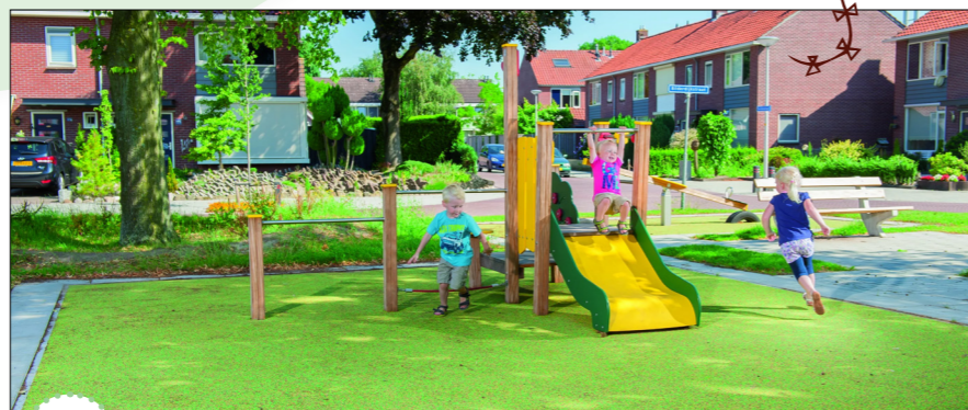
2 Speelhuisje met duikelrek, balanstouw en glijbaan