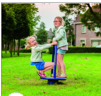
4 Draaitoestel ref.