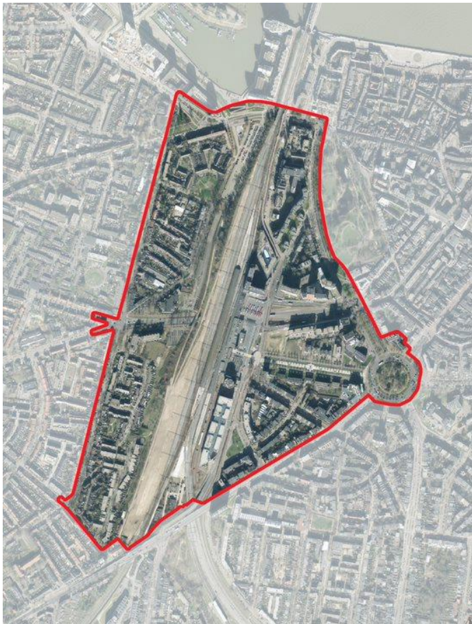
Figuur 1: Scopekaart gebiedsvisie

Het projectgebied stationsgebied en loopt van de Waal tot aan het spoorviaduct Graafseweg, en van het Keizer Karelplein tot het kruispunt “de vijfknop” in Nijmegen-West. Het grenst aan de wijken Benedenstad, Stadscentrum, Bottendaal, Wolfskuil en de Biezen. De scope voor de gebiedsvisie is op onderstaande kaart weergegeven. Deze scope is ruimer dan de concrete projectenkaart van het stationsgebied.