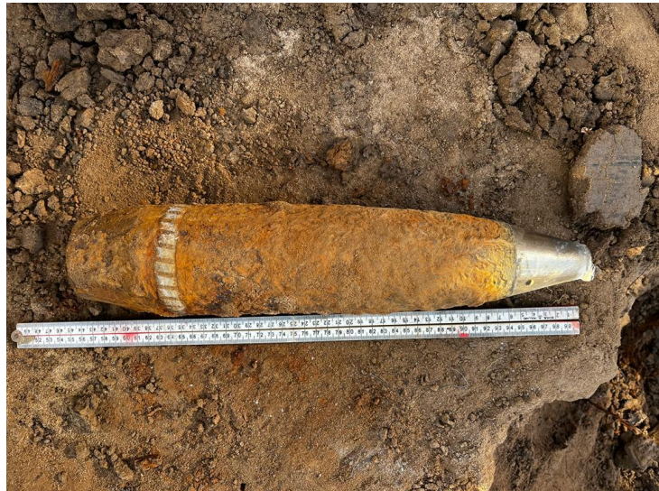
25-ponder van 110 cm, gevonden onder voormalige fruitboomgaard

Voordat er bouwwerkzaamheden plaatsvinden, onderzoeken gespecialiseerde opsporingsbedrijven een gebied op de aanwezigheid van ontplofbare oorlogsresten (OO). Binnen gemeente Nijmegen worden OO onderzoeken op dit moment uitgevoerd door de firma Bodac of door de combinatie Van Heteren T&A Survey. We noemen dat onderzoek Opsporing Ontplofbare Oorlogsresten (OOO). Tijdens de werkzaamheden gebruiken deze bedrijven speciale apparatuur om oorlogsresten in de grond te detecteren. Vervolgens interpreteren specialisten deze detectieresultaten zodat kan worden bepaald waar de grond moet worden afgegraven.