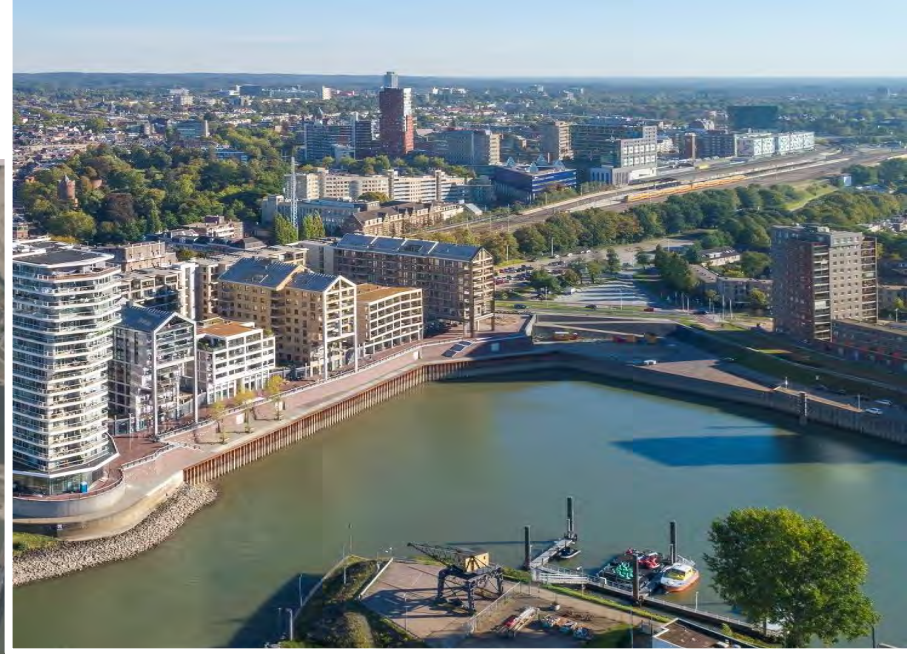
Kop van de spoorzone & deel van het decor rondom de Waalhaven