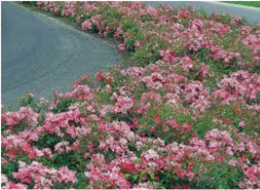
Rosa Floriade 2002 ® | Boomkwekerij...