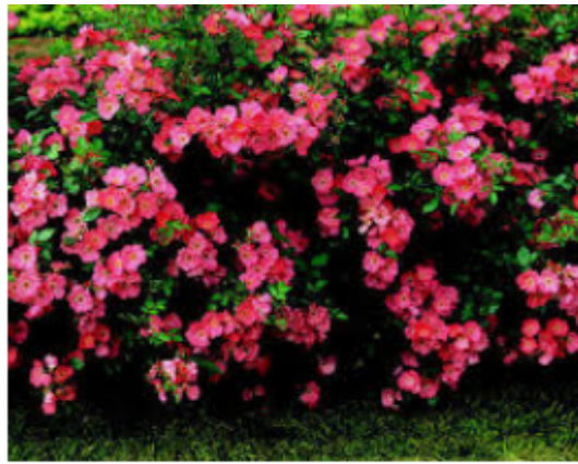
Rosa Amstelveen ® | Boomkwekerij D...