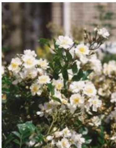
Rosa GOLF® | Boot & Dart