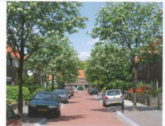
Meelbessen in zijstraat