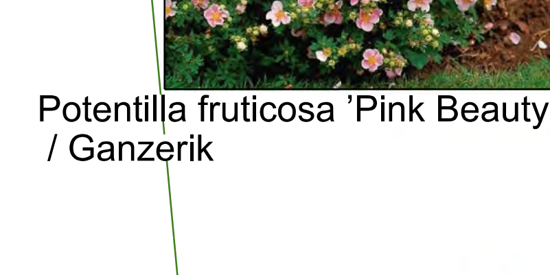
Potentilla fruticosa 'Pink Beauty' / Ganzerik