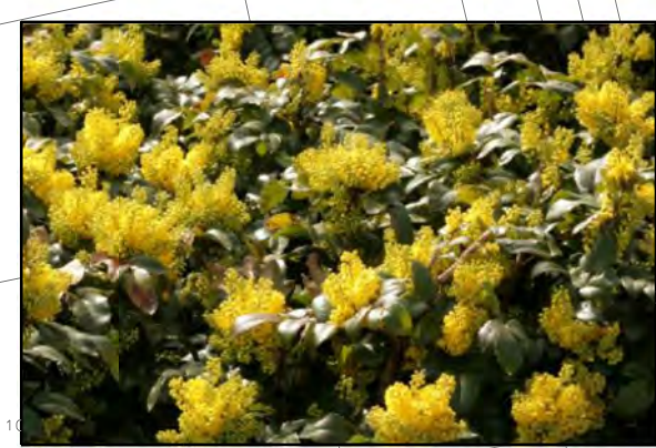
Mahonia aquifolium 'Apollo' / Mahoniestruik