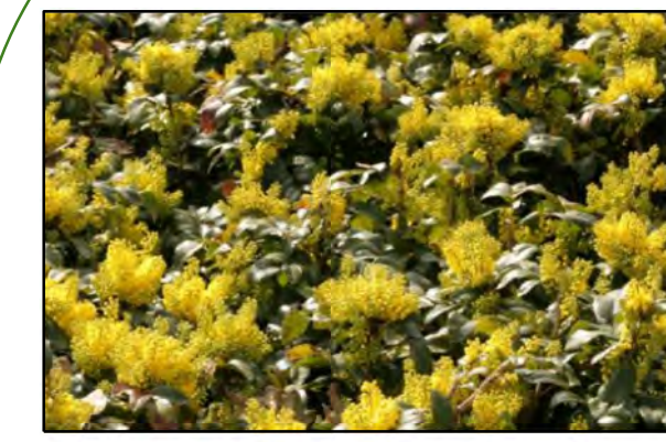
Mahonia aquifolium 'Apollo' / Mahoniestruik