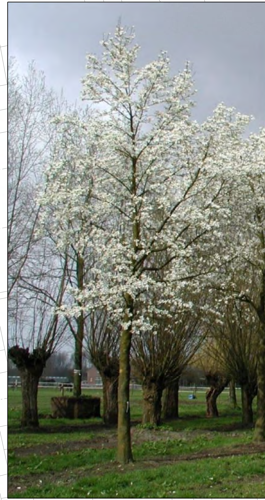
Magnolia kobus / Beverboom