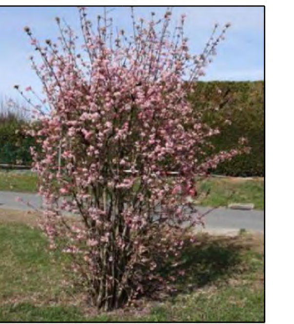
Viburnum bodnatense 'Dawn' / Sneeuwbal