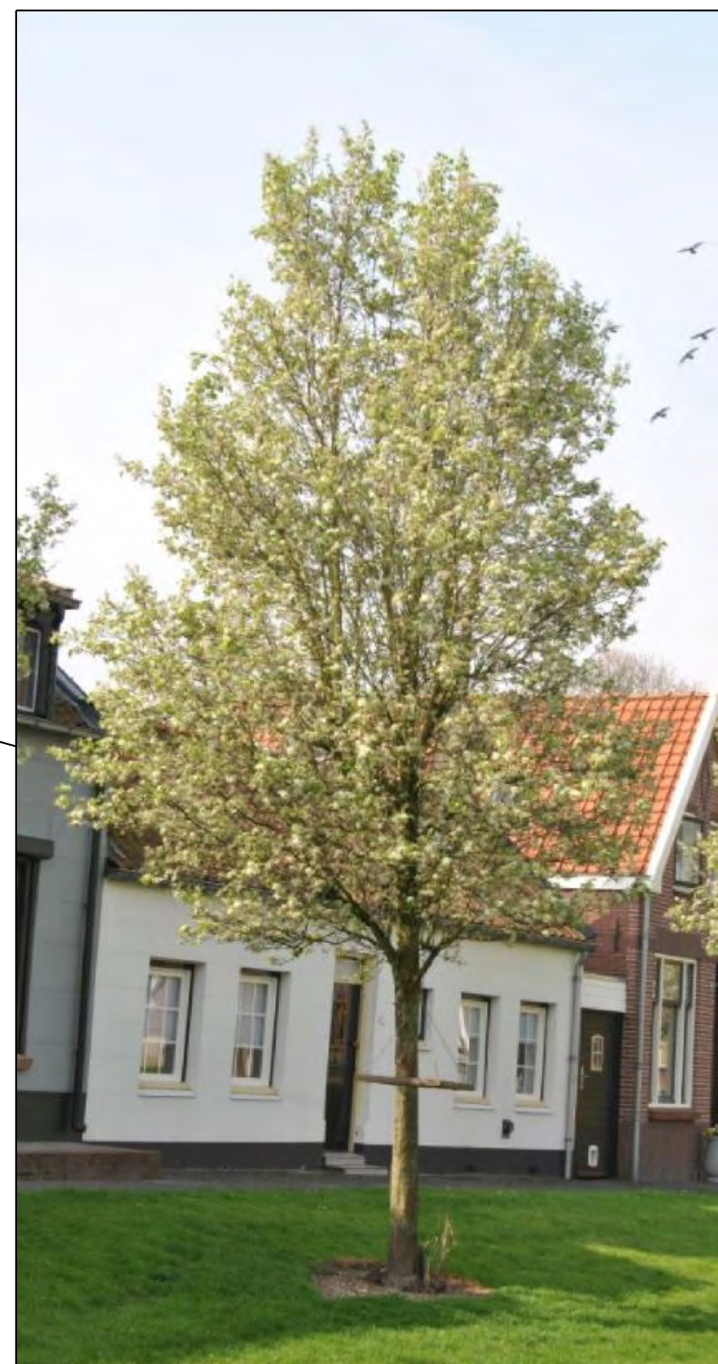
Pyrus calleryana 'Chanticleer' / Sierpeer