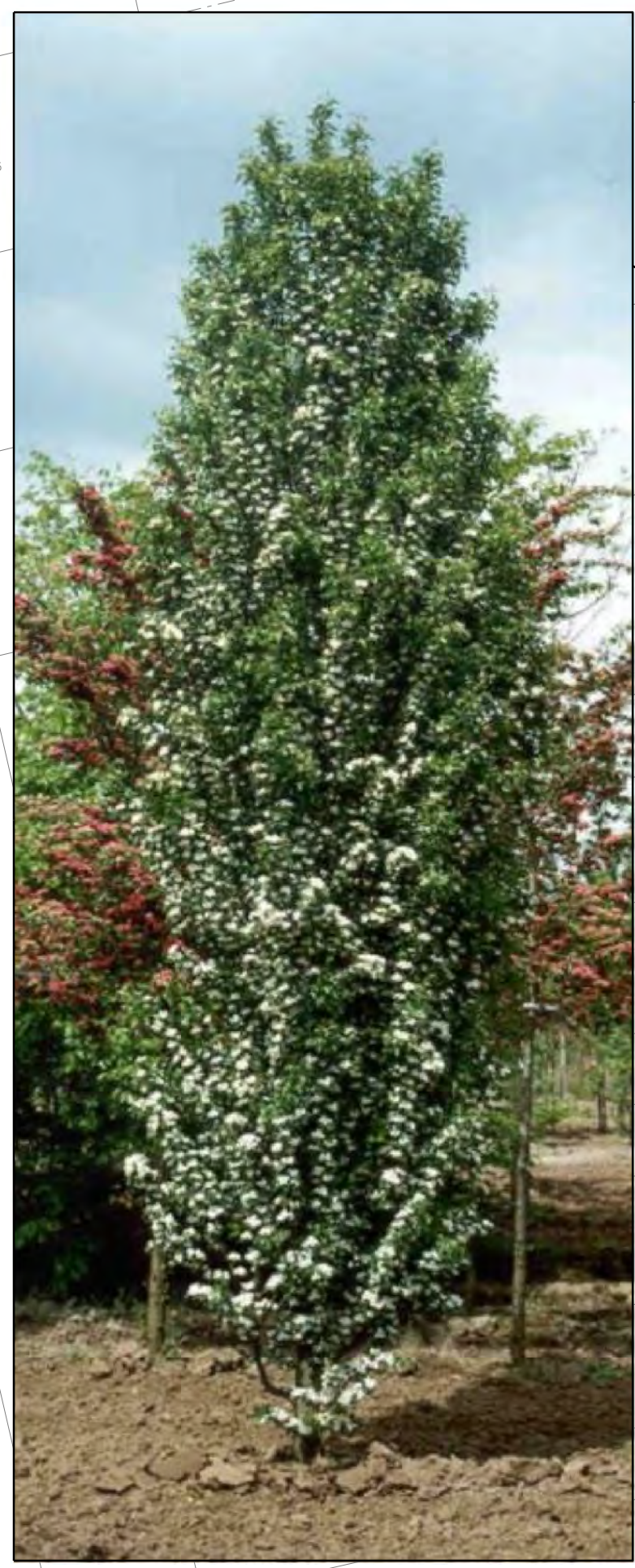
Crataegus monogyna 'Stricta' / Meidoorn