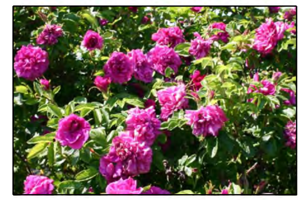
Rosa rugosa 'Hansa' / Bottelroos