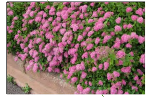
Spiraea bumalda 'Anthony W' / Spierstruik