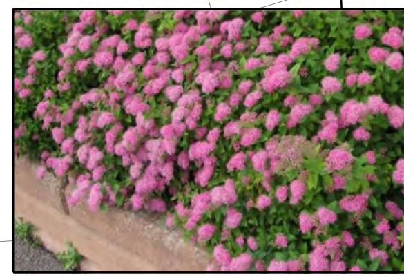
Spiraea bumalda 'Anthony Waterer' / Spierstruik