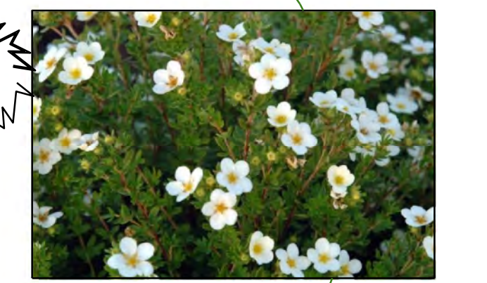
Potentilla fruticosa 'McKay's White' / Ganzerik