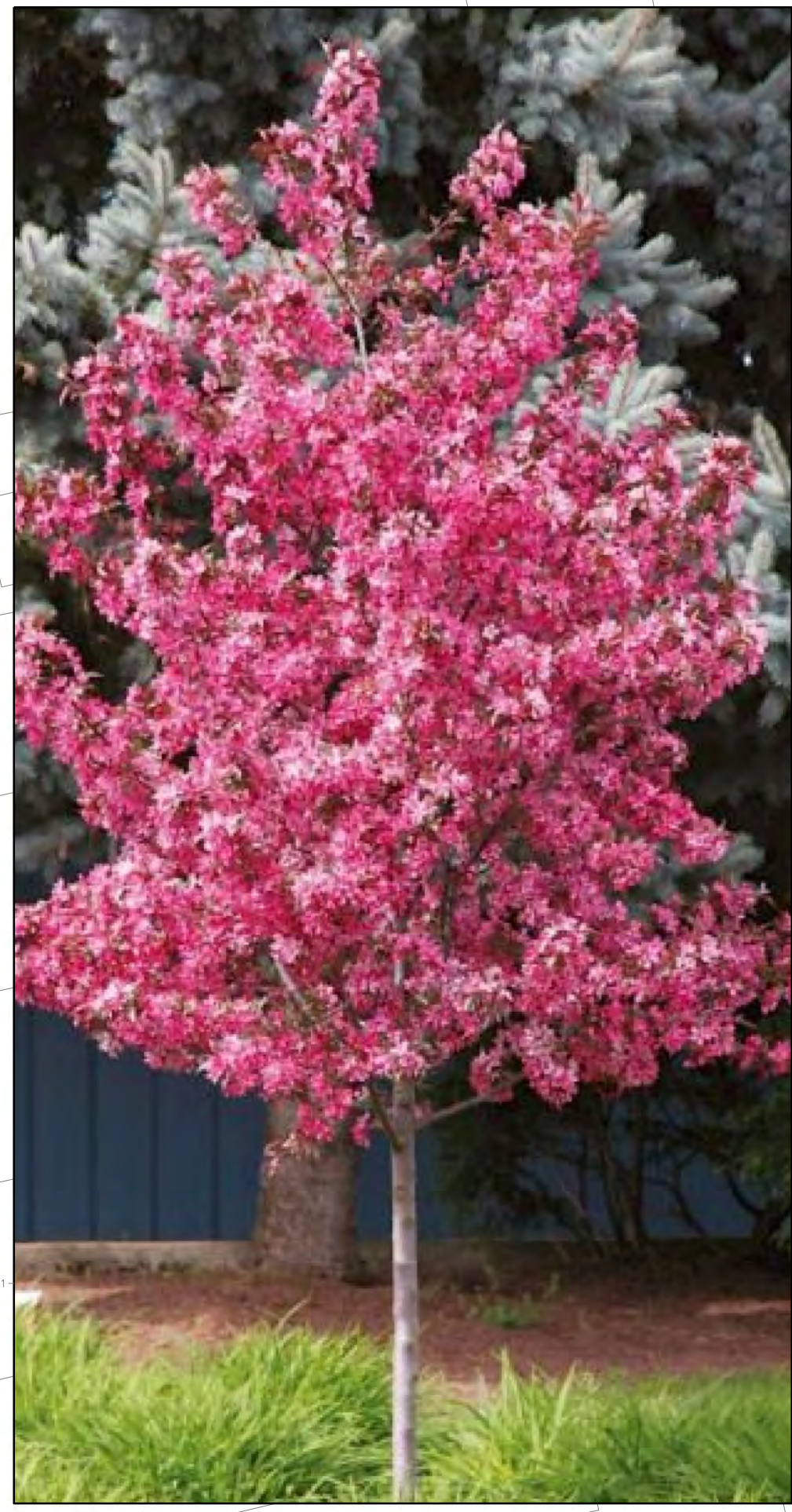
Malus 'Royal Raindrops' / Sierappel