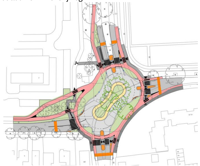
Het ontwerp van de rotonde Houtlaan

Het ontwerp van de rotonde was nog niet zo eenvoudig omdat de beschikbare ruimte beperkt is. Het ontwerp houdt rekening met de beperkte ruimte en biedt tegelijkertijd kansen om het kruispunt groener en veiliger te maken. De werkzaamheden starten naar verwachting na de zomer van 2026. De aanleg van de rotonde duurt ongeveer drie maanden. Omwonenden ontvangen te zijner tijd een uitnodiging voor een informatiebijeenkomst over de plannen en uitvoering.