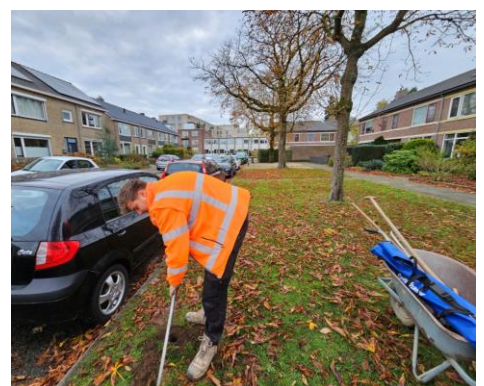
Archeologisch onderzoek in de buurt