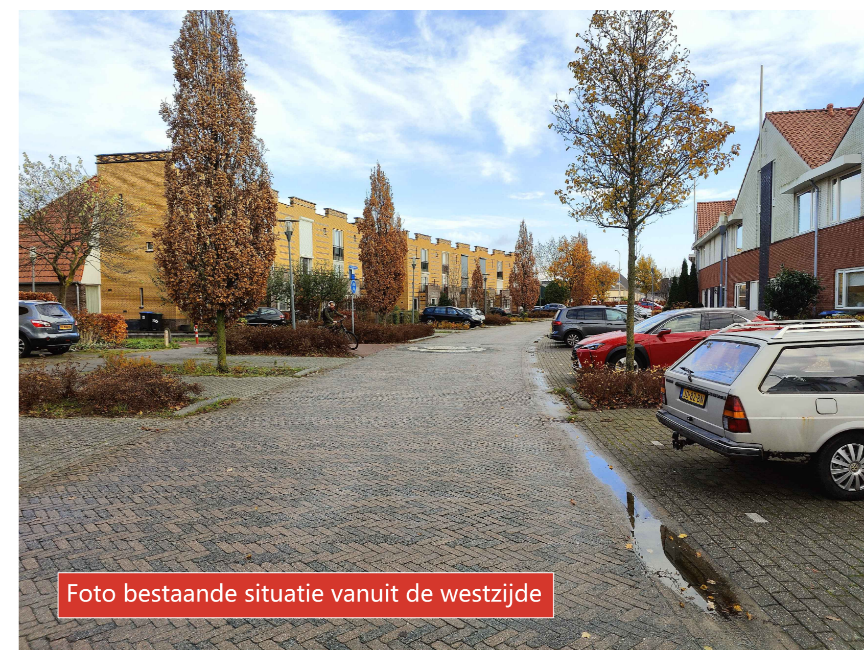
Foto bestaande situatie vanuit de westzijde