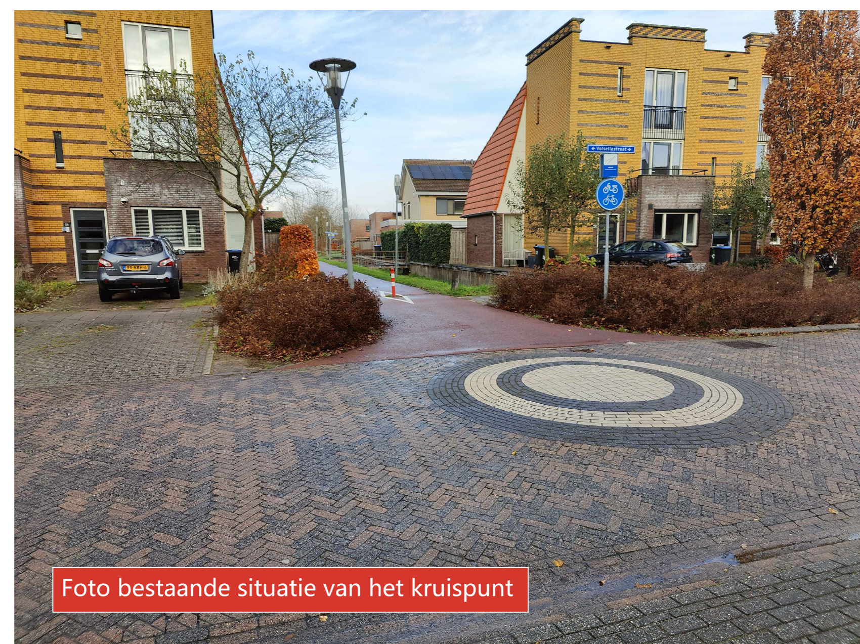
Foto bestaande situatie van het kruispunt