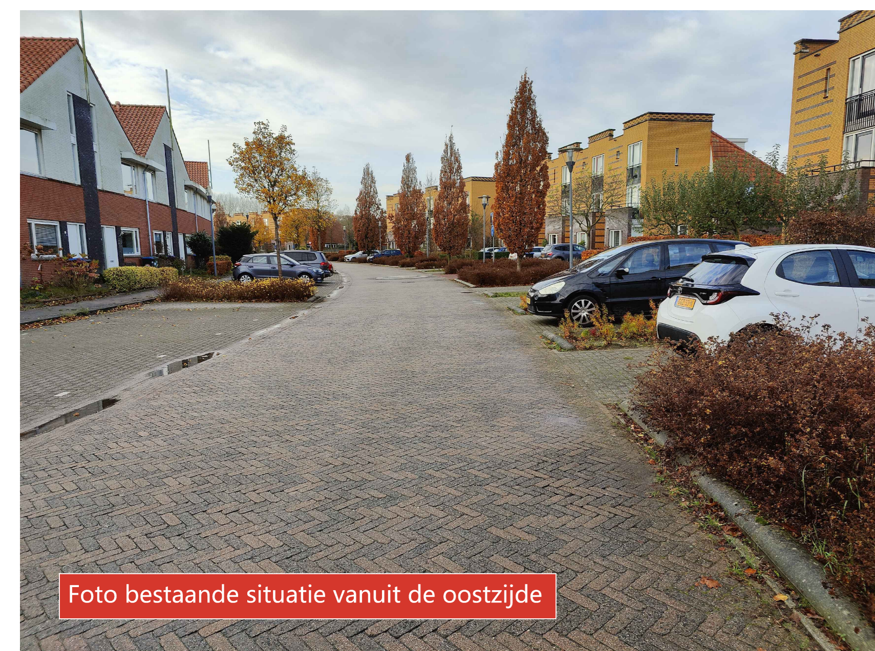
Foto bestaande situatie vanuit de oostzijde

Bestrating rondom het plateau herstraten in verband met het hoogteverschil.