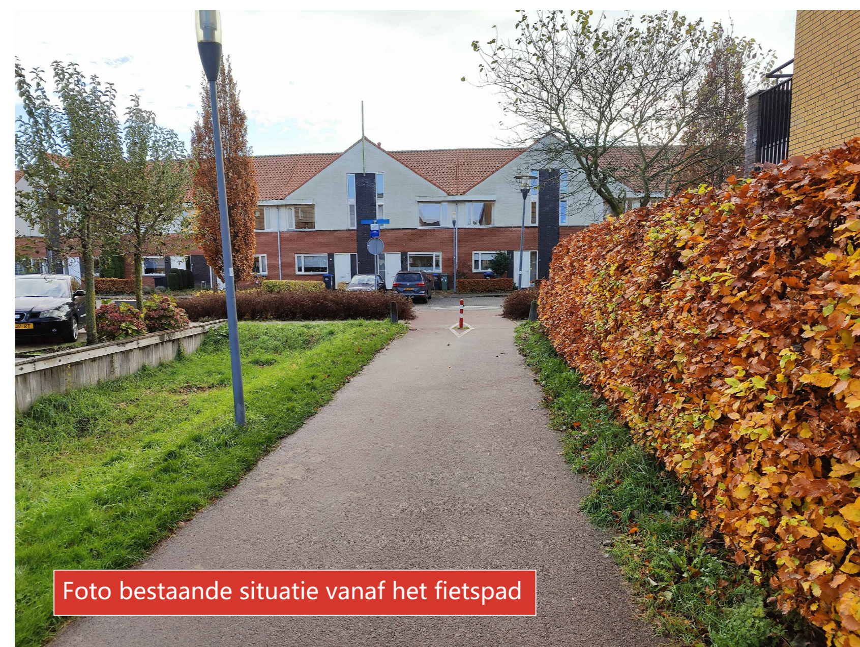
Foto bestaande situatie vanaf het fietspad