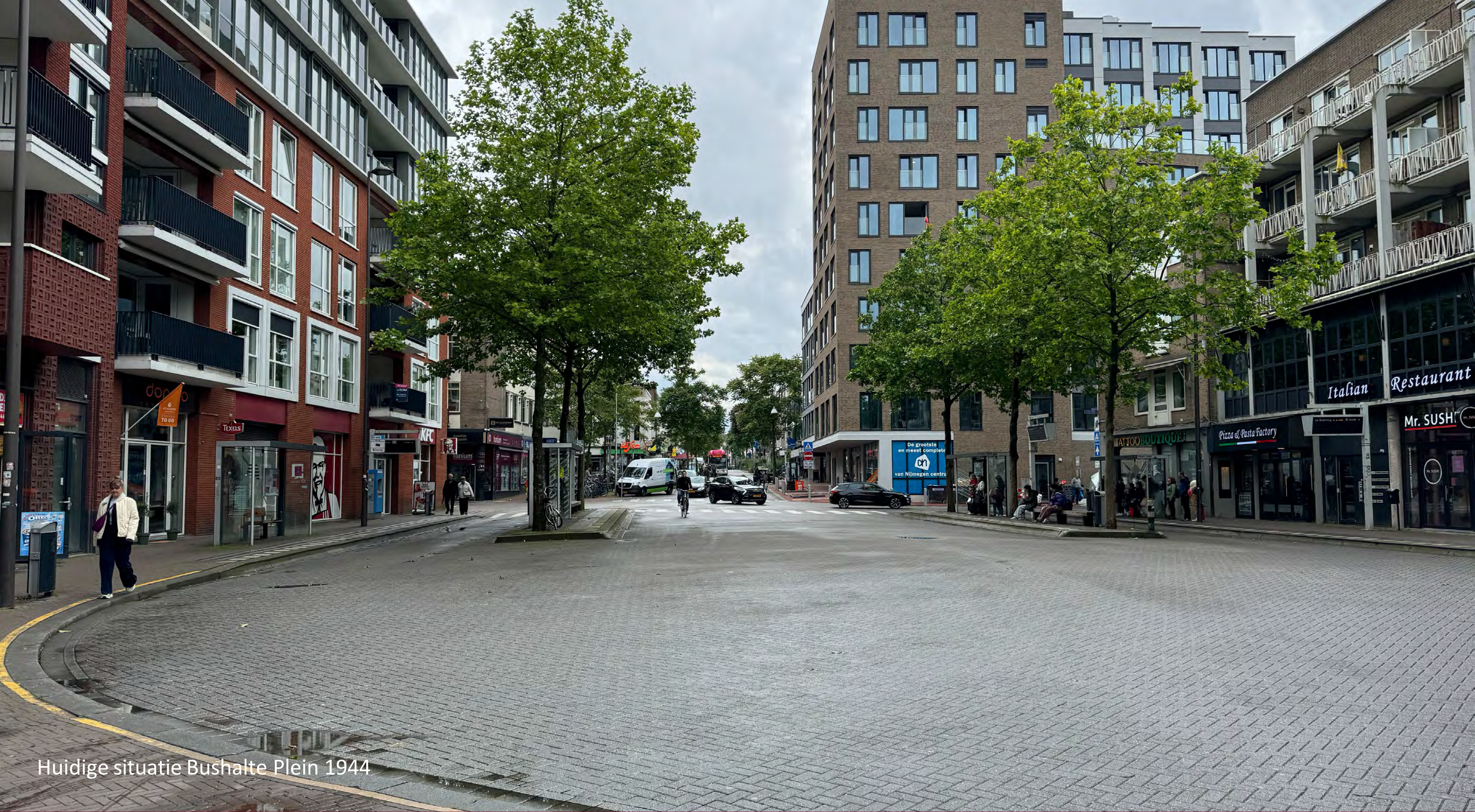
Huidige situatie Bushalte Plein 1944