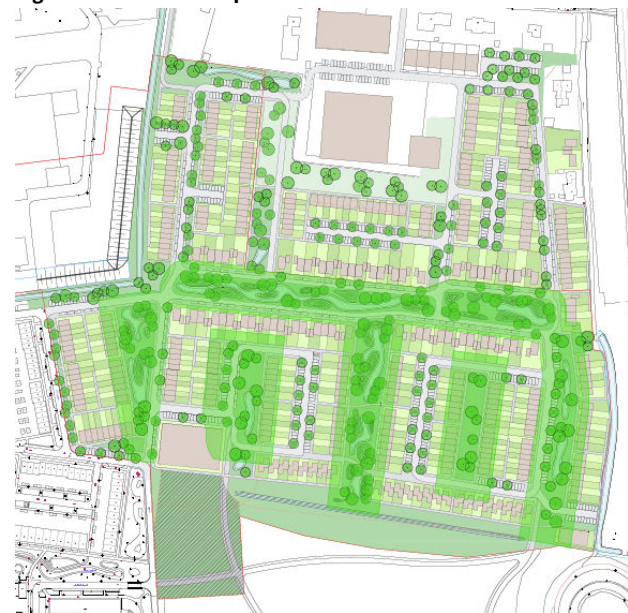
Figuur 2. Schetsontwerp Zuiderveld Oost

In figuur 2 is de meest recente stedenbouwkundige proefverkaveling weergegeven. Op basis van de verkennende fase is de voorgaande stedenbouwkundige proefverkaveling nog iets aangepast. Het ingekleurde deel is fase 1 van de planontwikkeling: het gebied waar deze bopa over gaat.