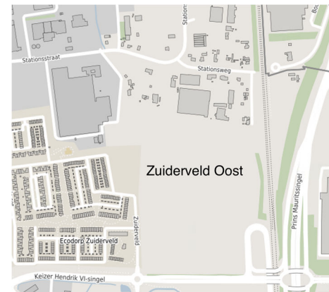
Figuur 1. Ontwikkeling Zuiderveld Oost

Voorafgaand aan het starten van de planologische procedure hebben de projectleider en omgevingsmanager gesprekken gevoerd met buurtbewoners en de wijkraden. Op basis van deze gesprekken is dit participatieplan opgesteld. Een verslag van de verkennende fase vindt u in de bijlage.