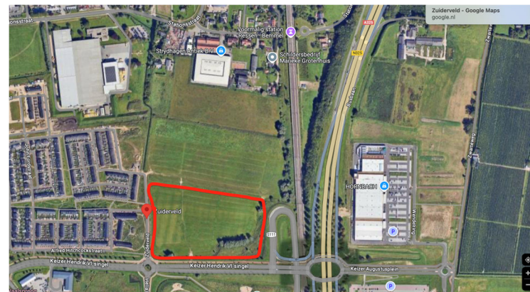
Figuur 1. Globale ligging archeologisch monument

De hoofdontsluiting gaat via de rotonde van de Keizer Hendrik VI-singel. Mogelijk dat er voor het langzame verkeer (voetgangers en fietsers) een ontsluiting komt richting het noorden (naar Ressen). Dit hangt af van de ontwikkeling/contacten met de bedrijven in het noorden. Verder komt in het plan ruimte voor een regio/brede basisschool (vrije school). Het plan voorziet niet in andere (commerciële) ruimtes/locaties.