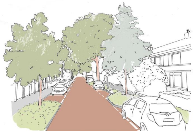
Impressie Kanunnik Pelsstraat

Wilt u weten hoe de omgeving er in uw straat uit kan komen te zien? Lees er dan snel meer over op nijmegen.nl/kanunnikenbuurt , bespreek het met de burens en bezoek de informatieavond op dinsdag 21 januari. Meer informatie over de informatieavond kunt u lezen in de uitnodigingsbrief. Ook kunt u de gemeente vragen stellen over het project via de website of kanunnikenbuurt@nijmegen.nl .