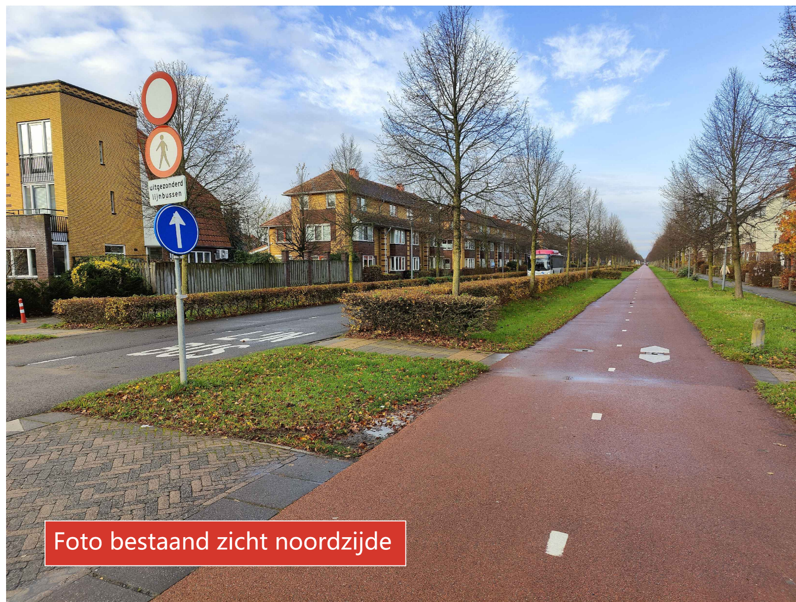
Foto bestaand zicht noordzijde