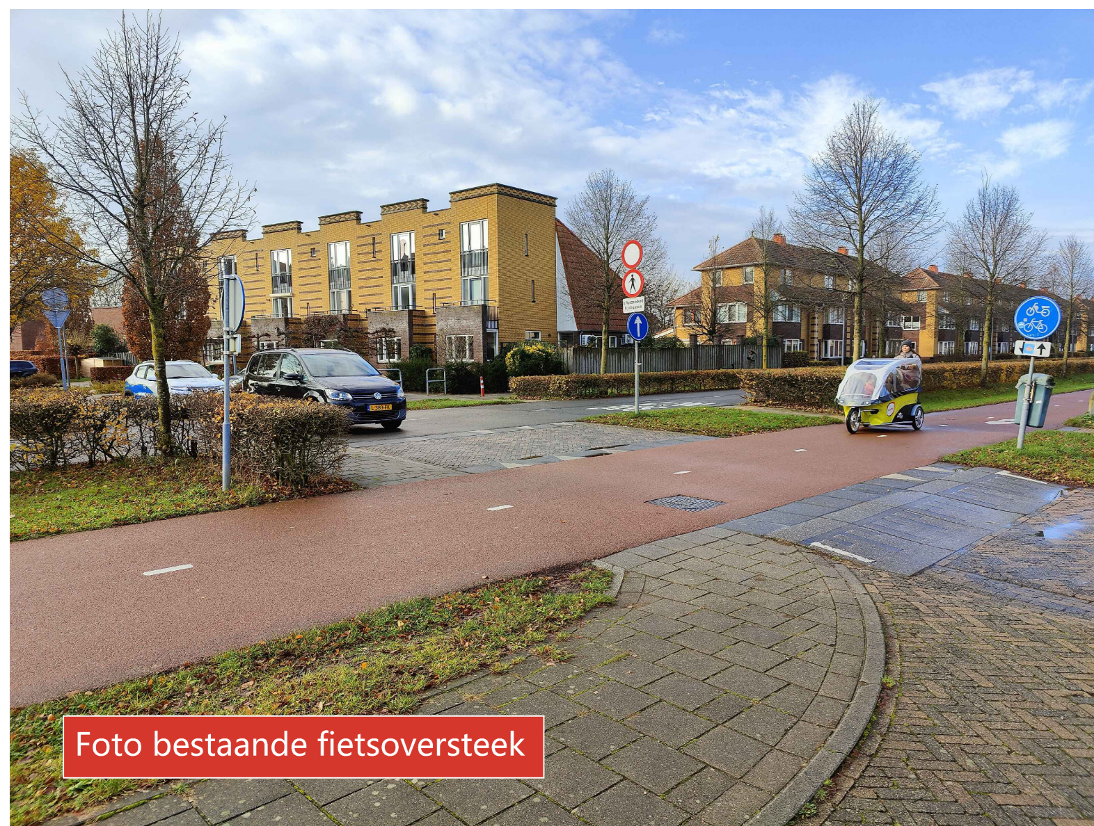
Foto bestaande fietsoversteek