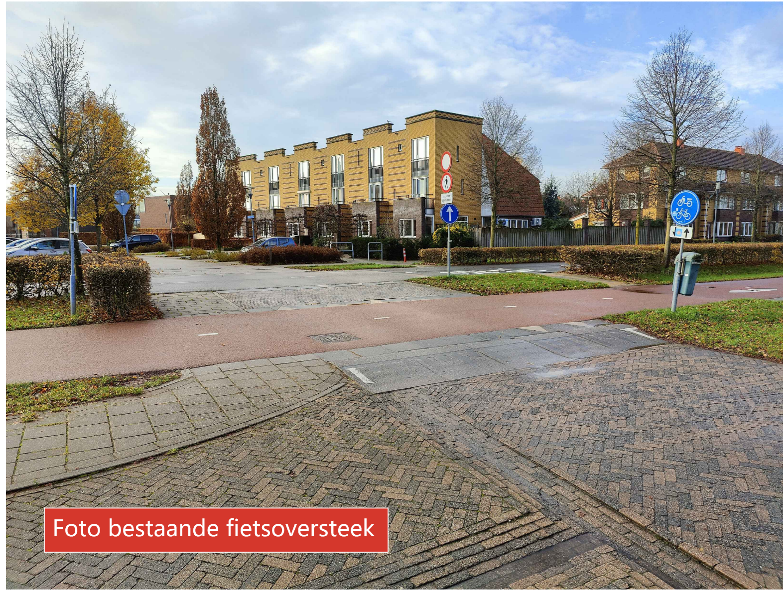
Foto bestaande fietsoversteek