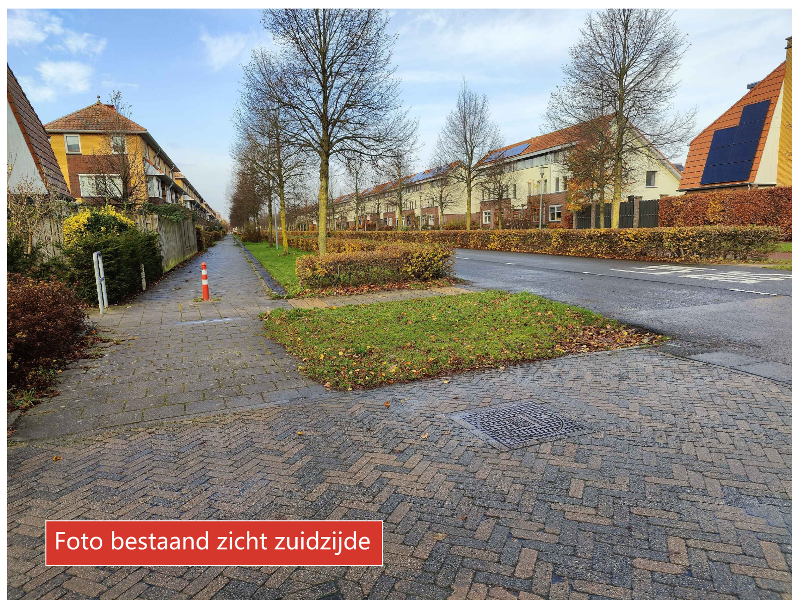
Foto bestaand zicht zuidzijde