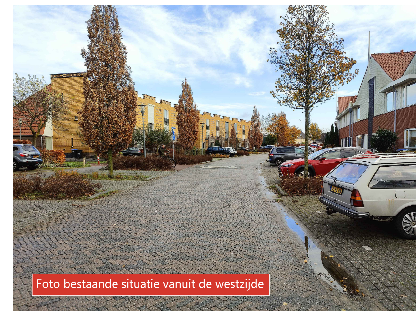
Foto bestaande situatie vanuit de westzijde