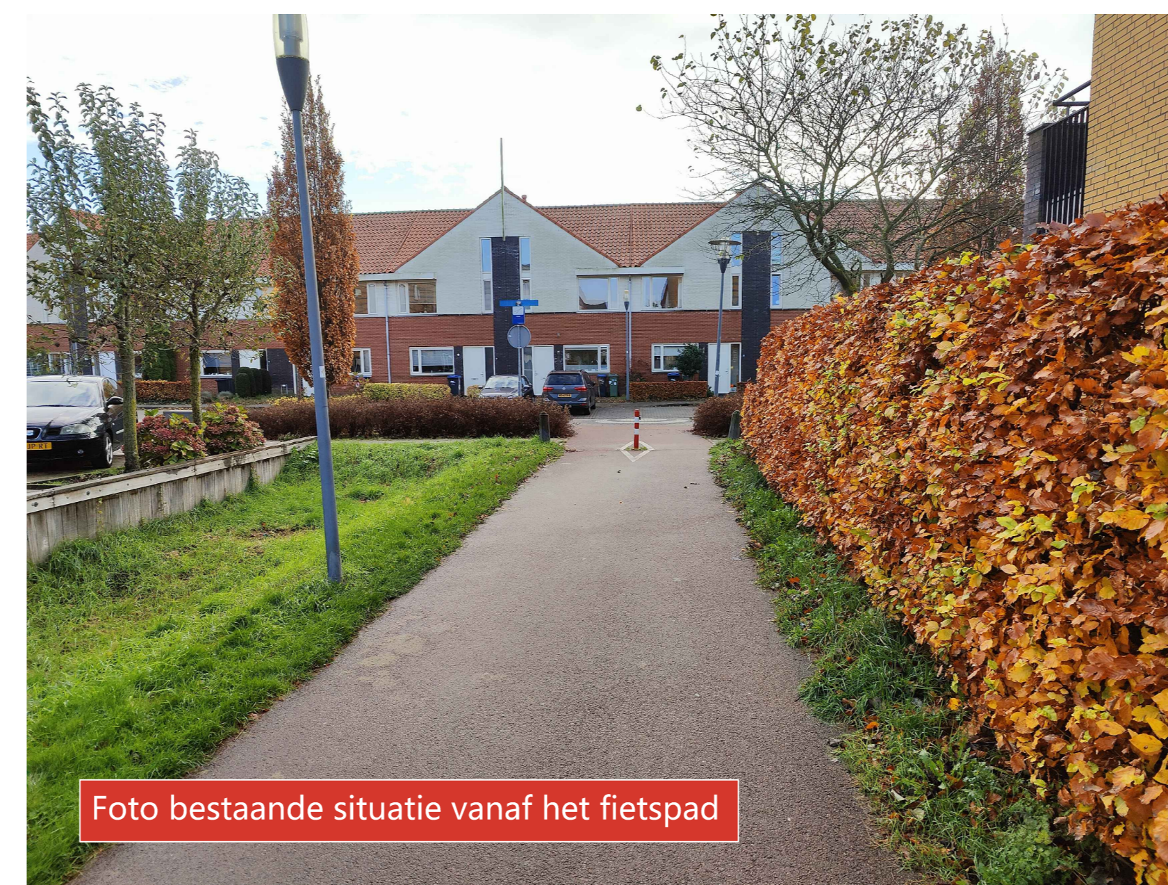
Foto bestaande situatie vanaf het fietspad