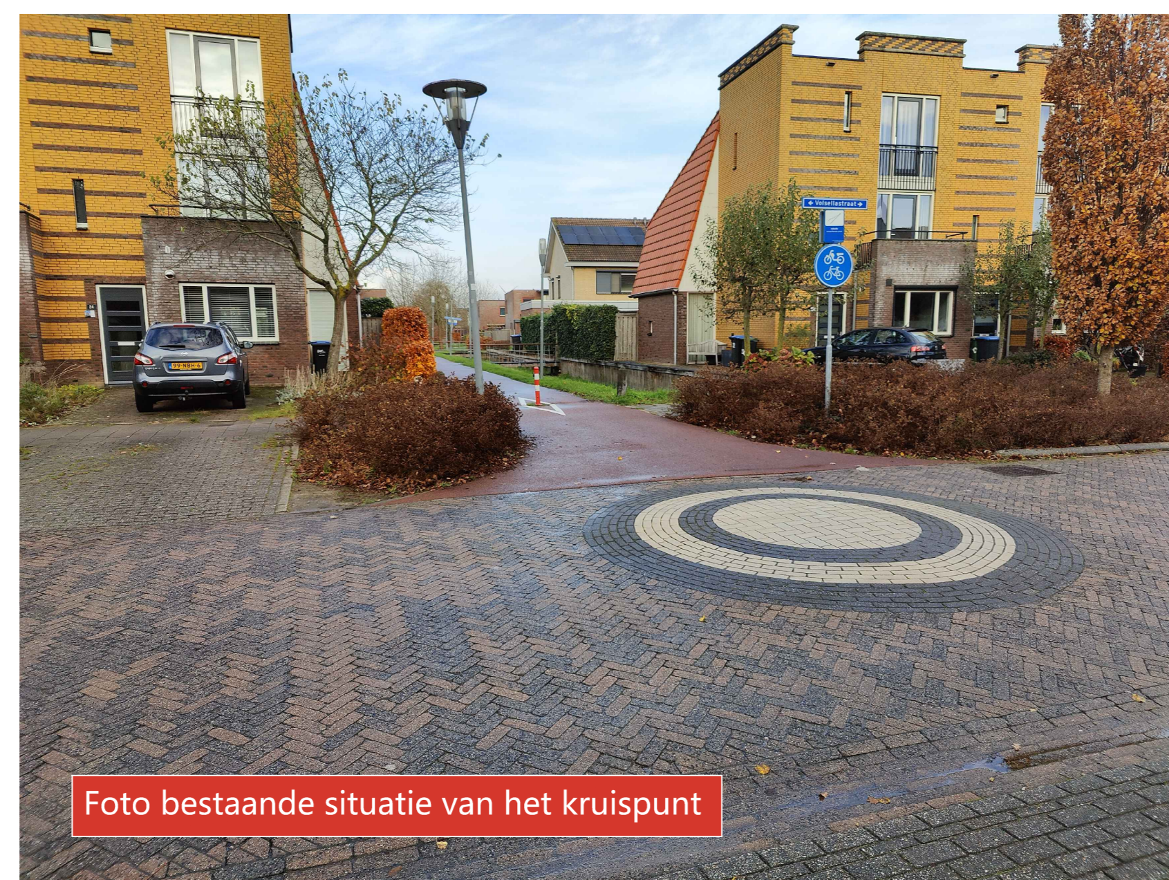
Foto bestaande situatie van het kruispunt