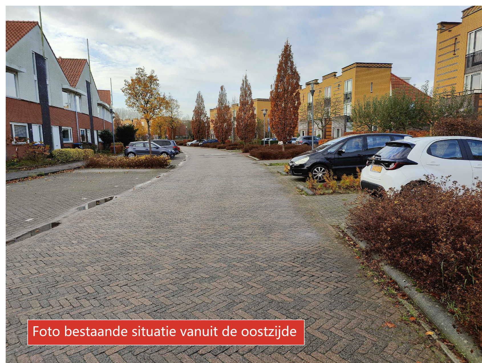
Foto bestaande situatie vanuit de oostzijde