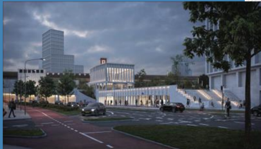
Bouw van Westentree