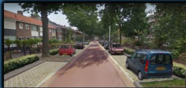
Fietsstraat Krayenhofflaan voor en na