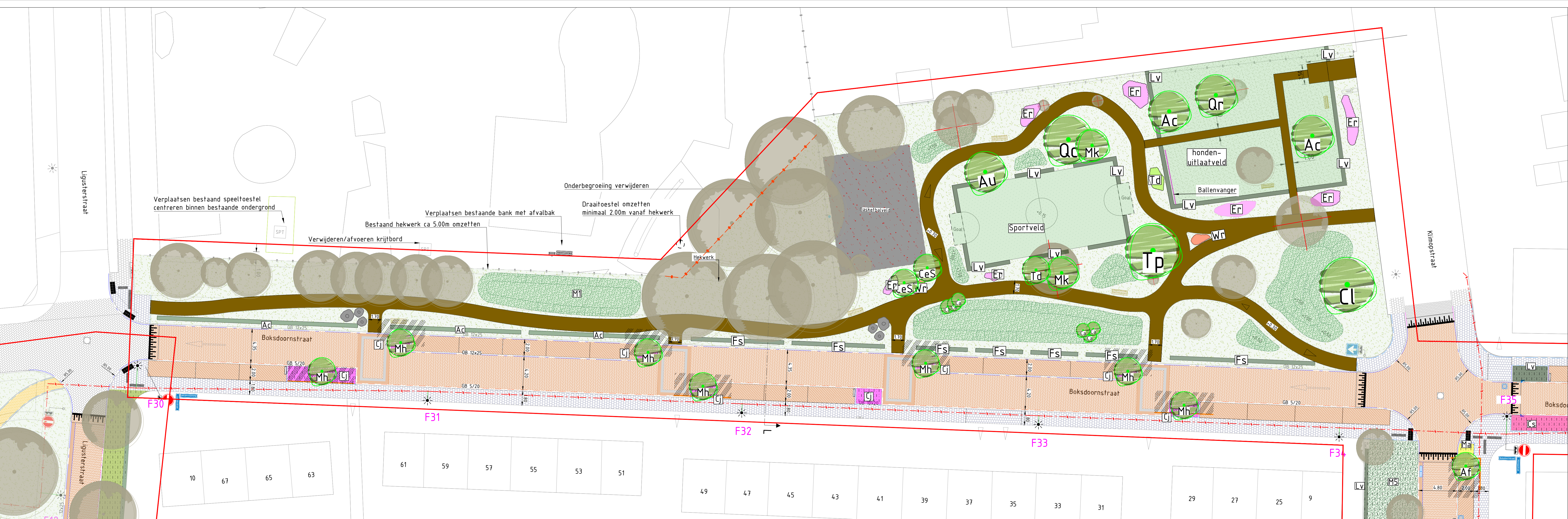
Situatie Schaal 1:200